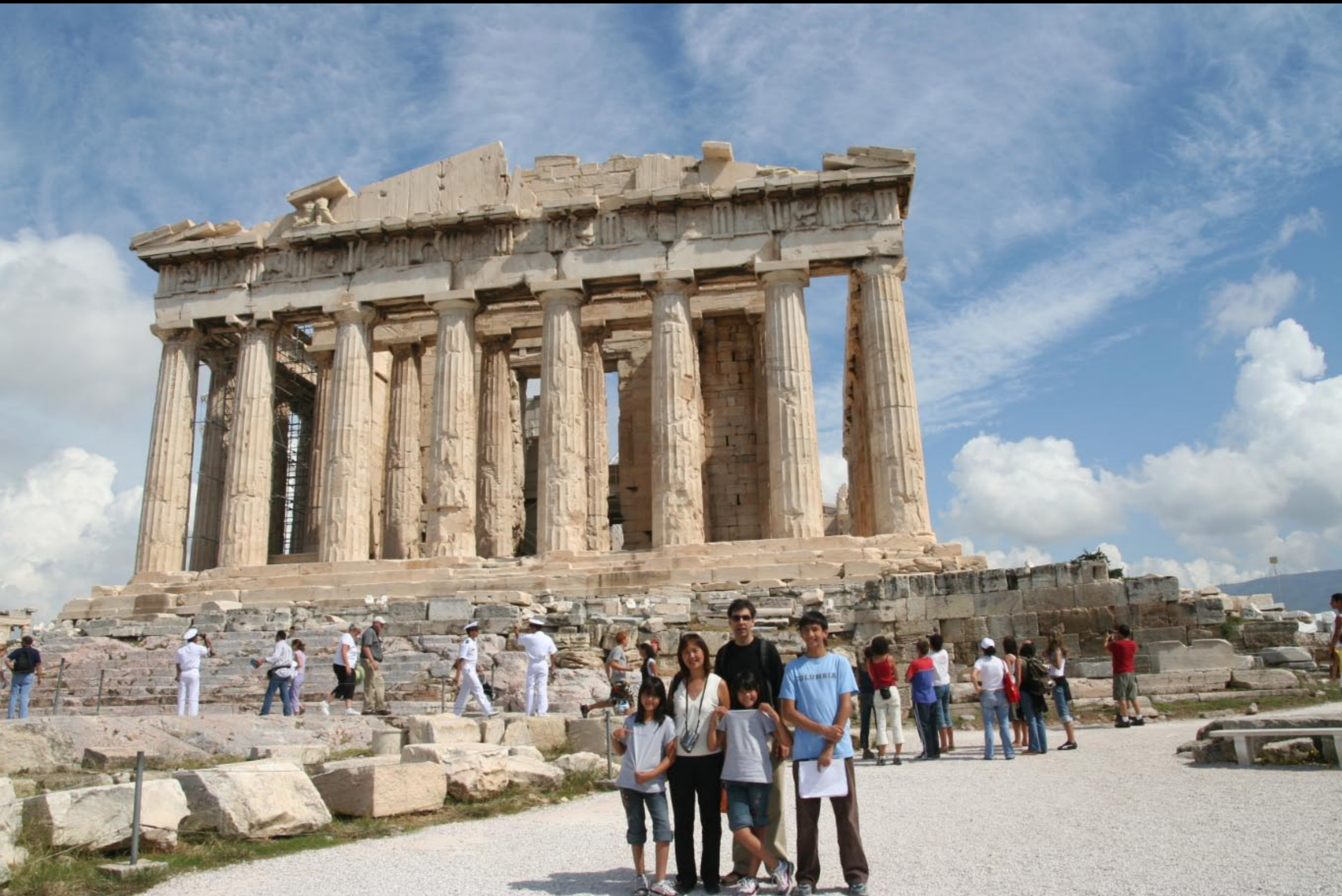
Sgouros's, sailors, parthenon and some interesting sky