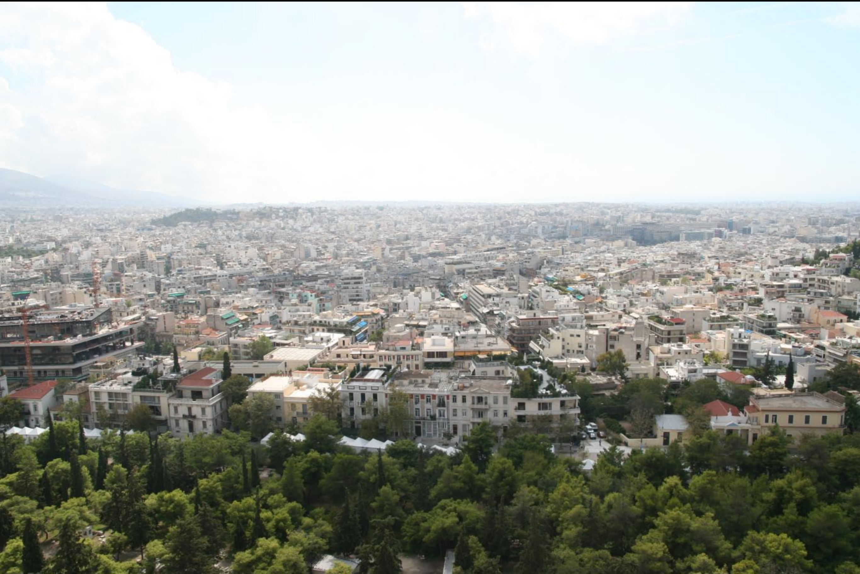
Athens from the Parthenon