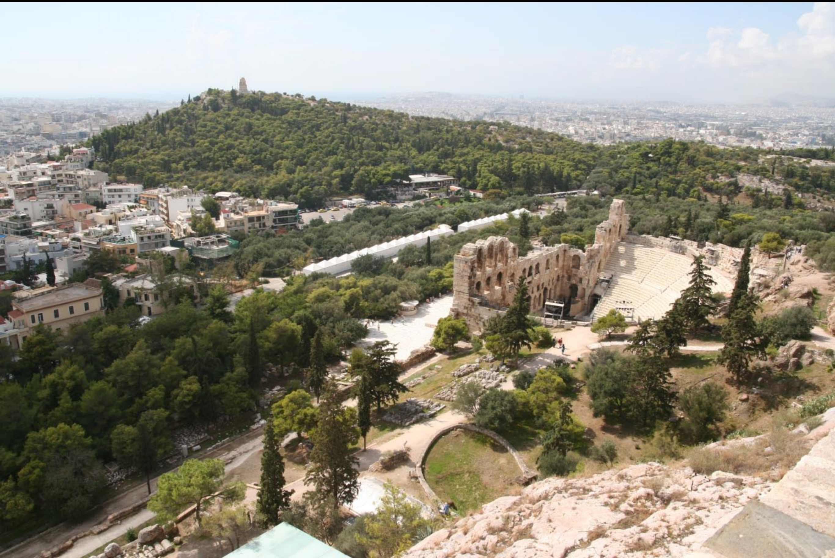
Odeon - where we attended MG Mythology Dance performance