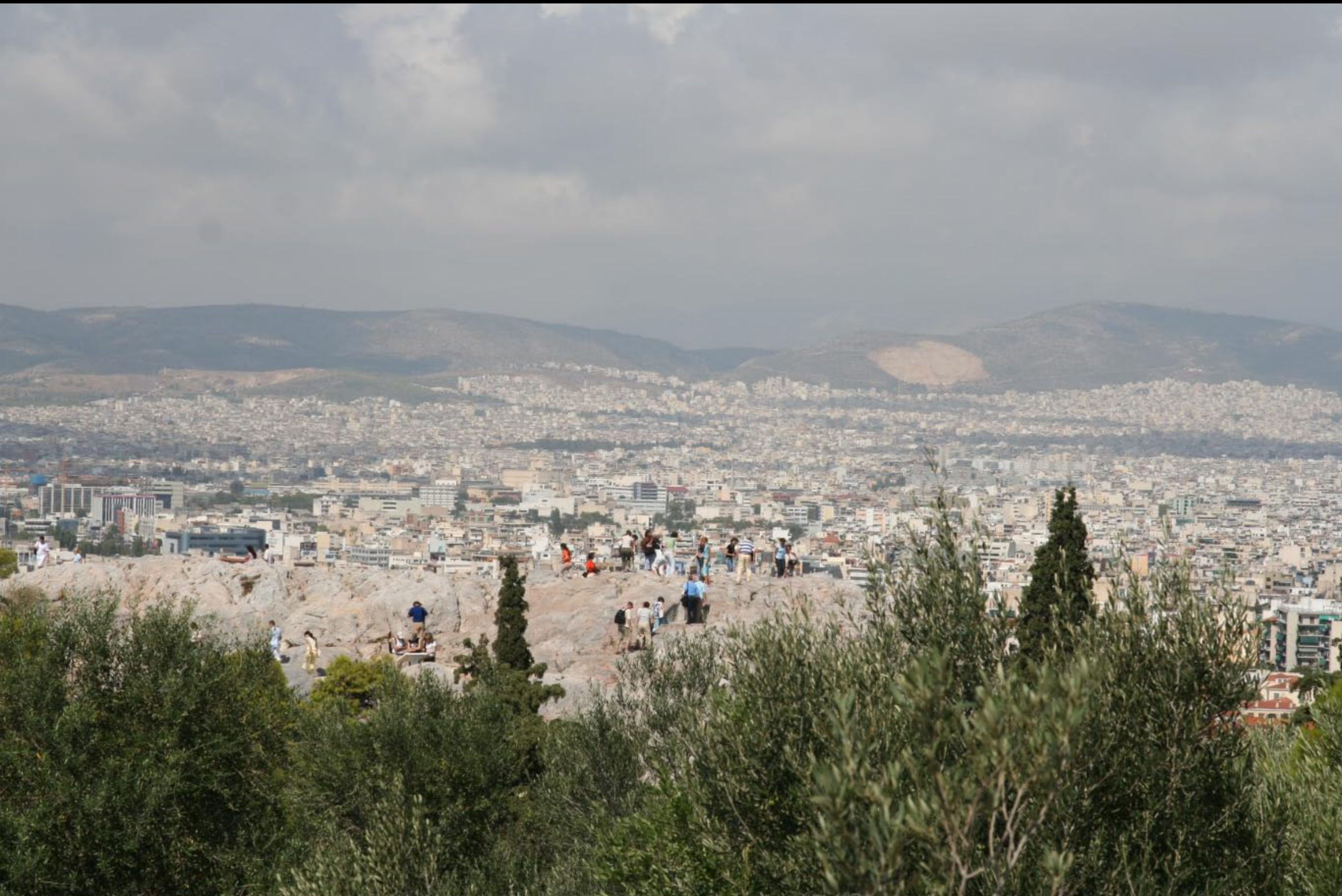
St. Paul Rock at which he preached Christianity to Greeks