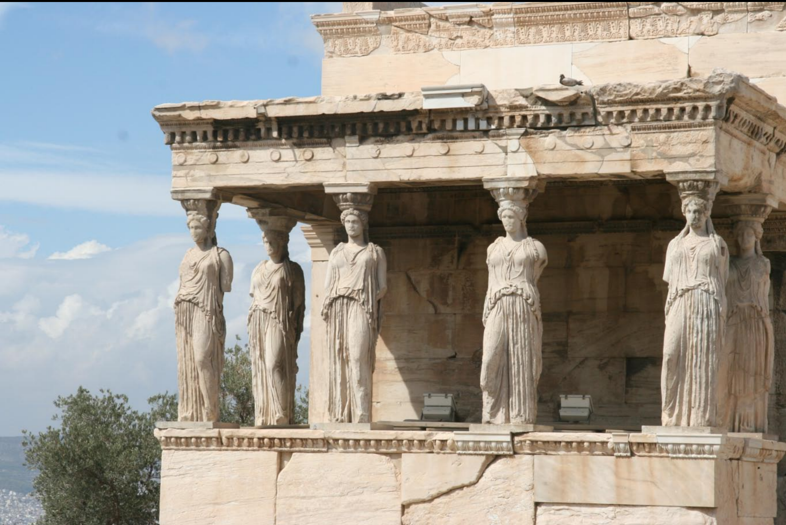
Closer view of C's