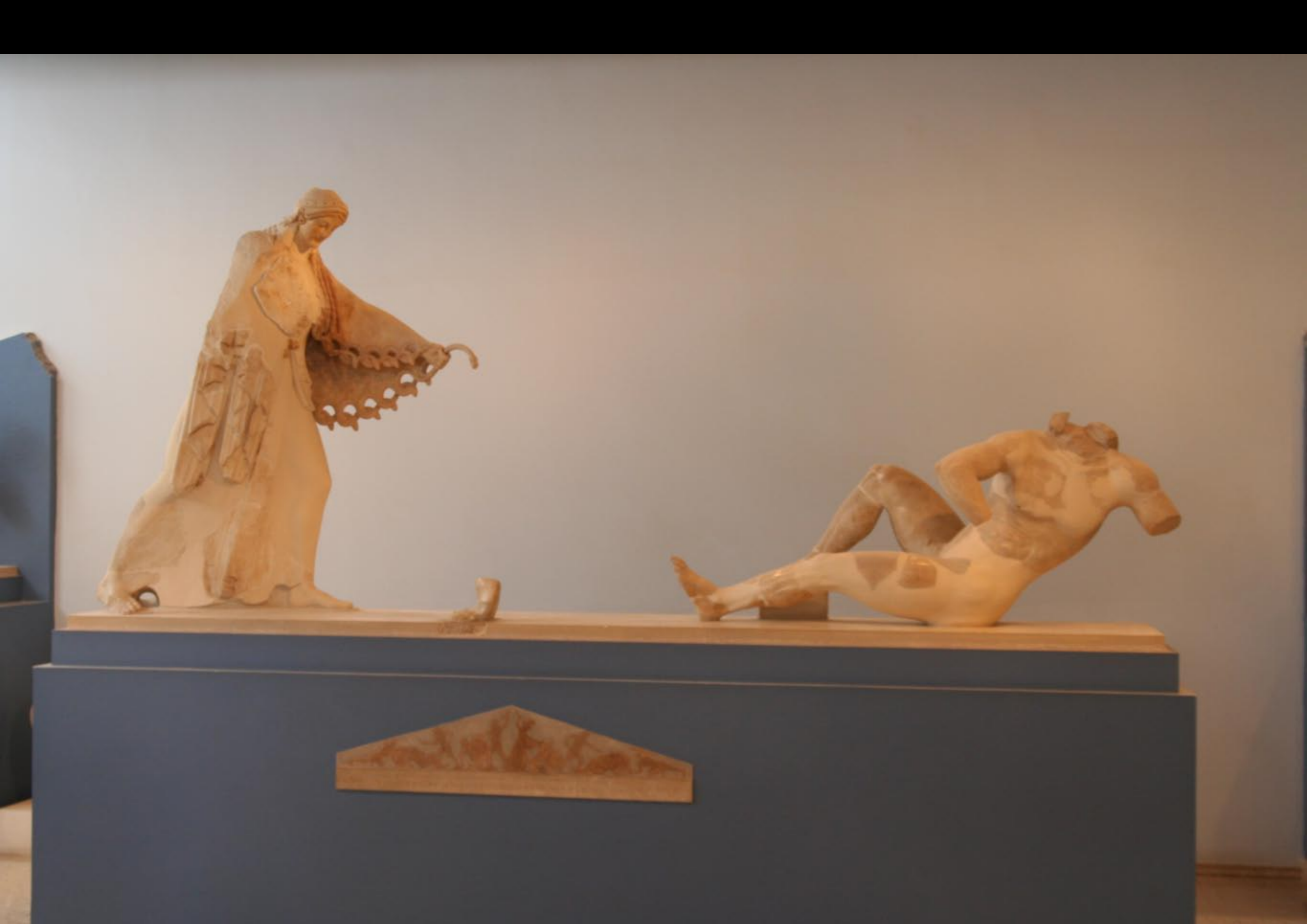
Acropolis Museum - Bits of a Frieze