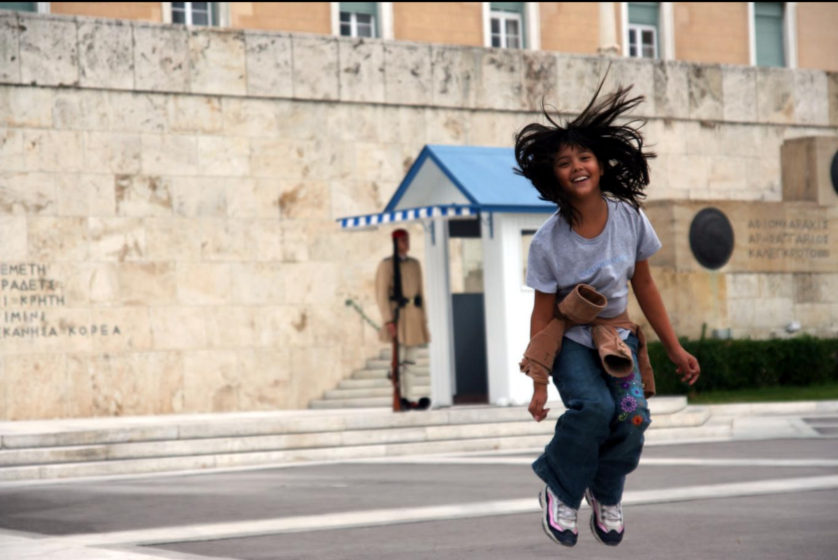
Tomb of the unknown Athens, Greece