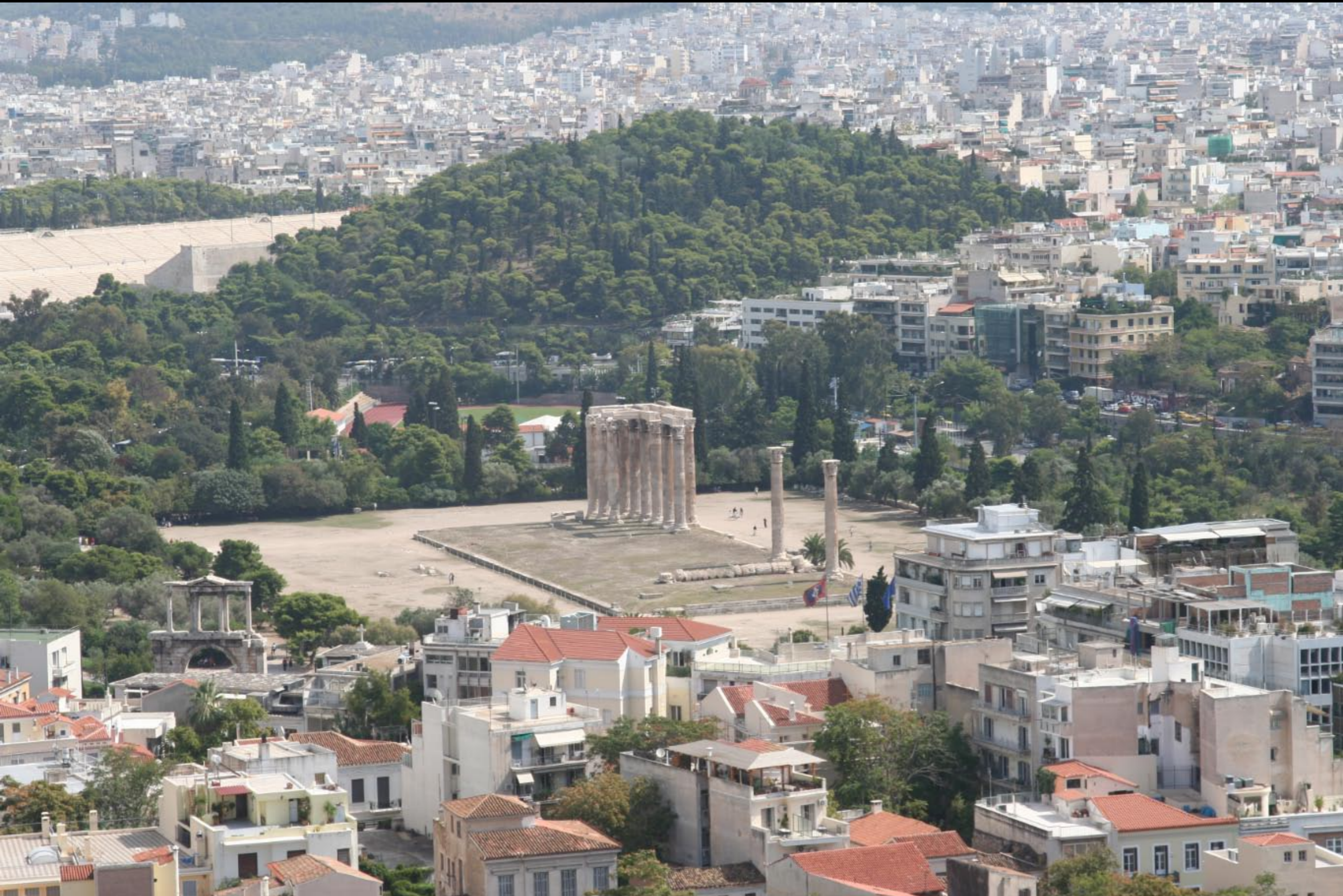
More really old columns