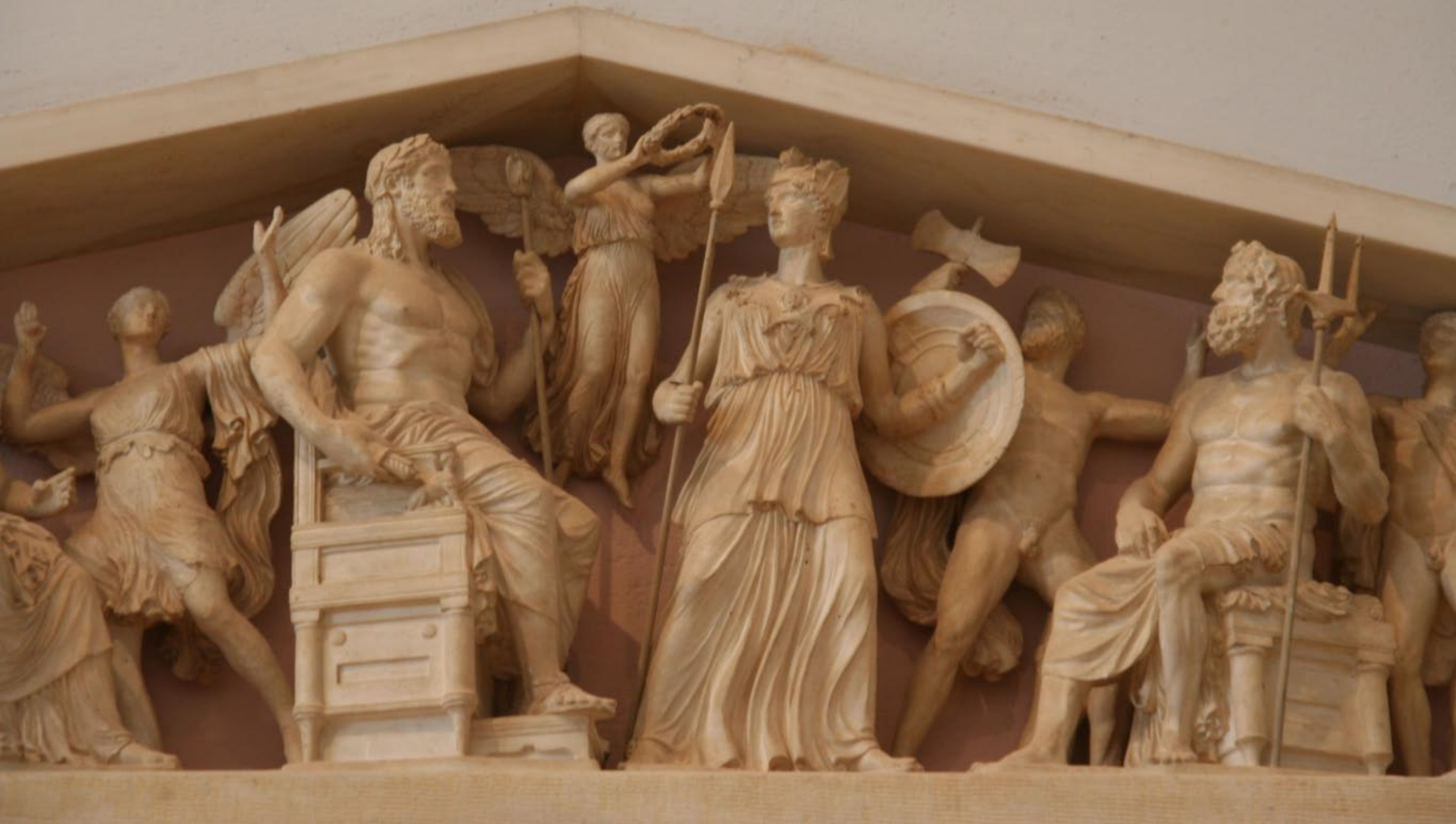
Acropolis Museum - Frieze showing Athena's birth