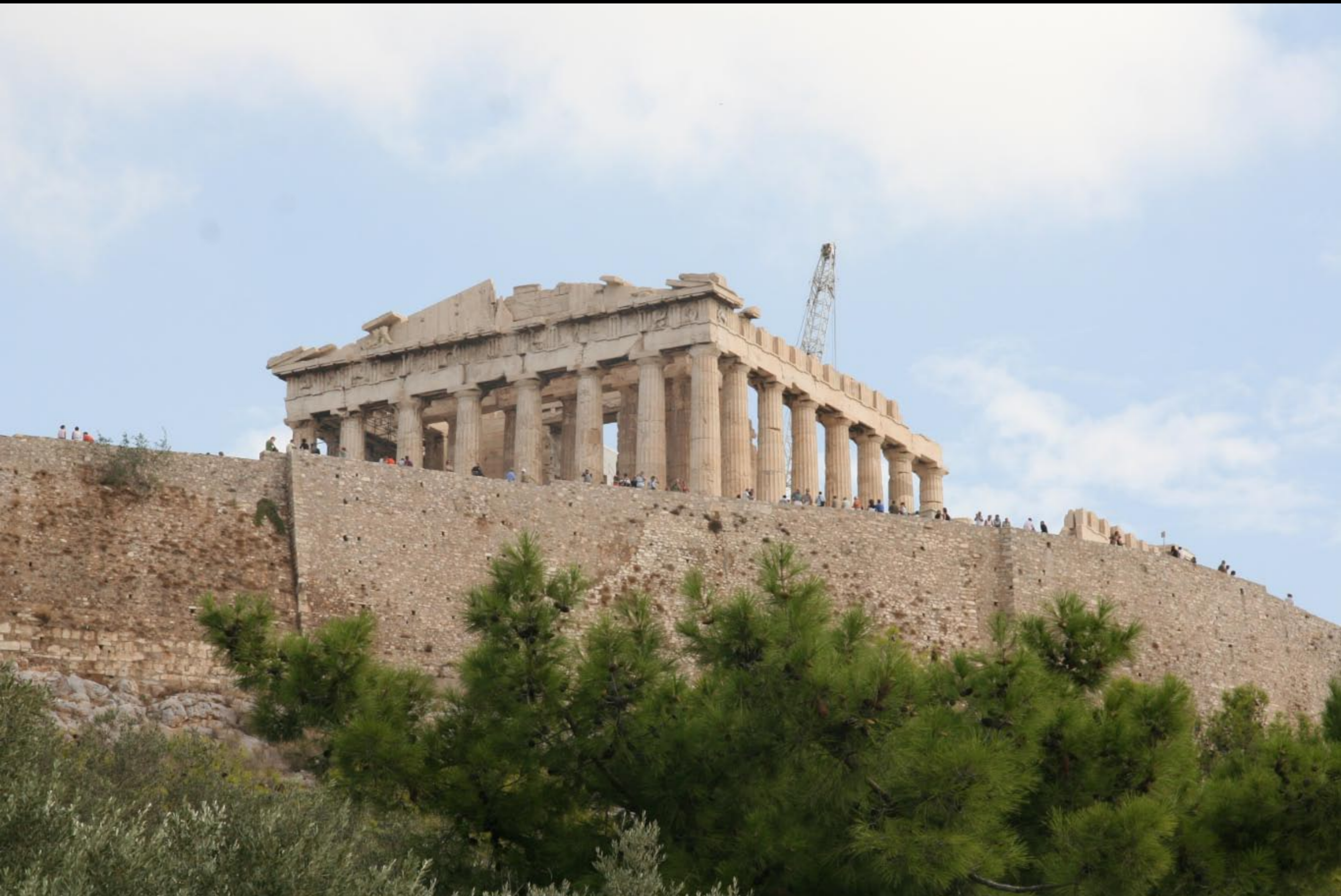
Athens - the acropolis