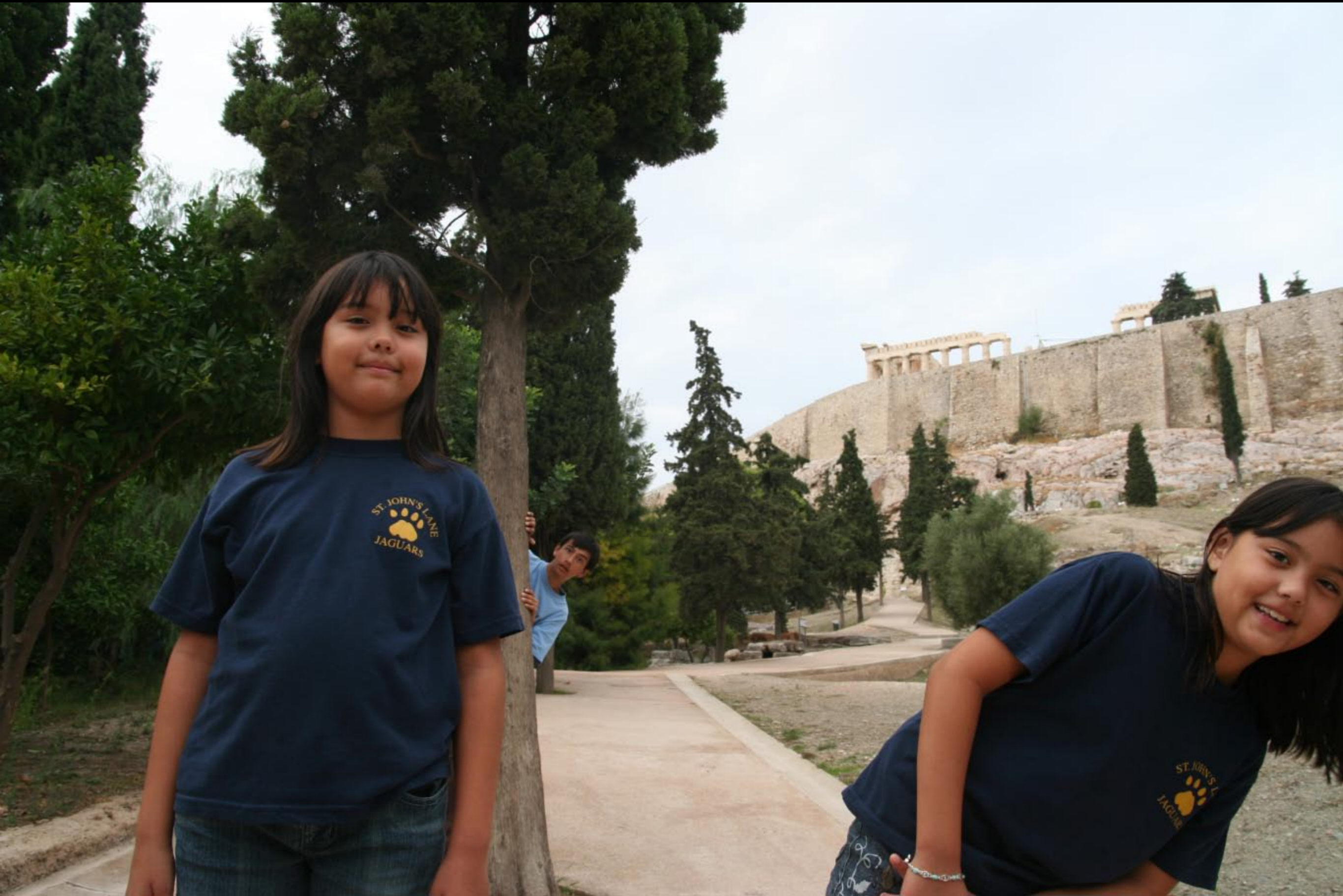
Jaguar T-Shirts & background 1