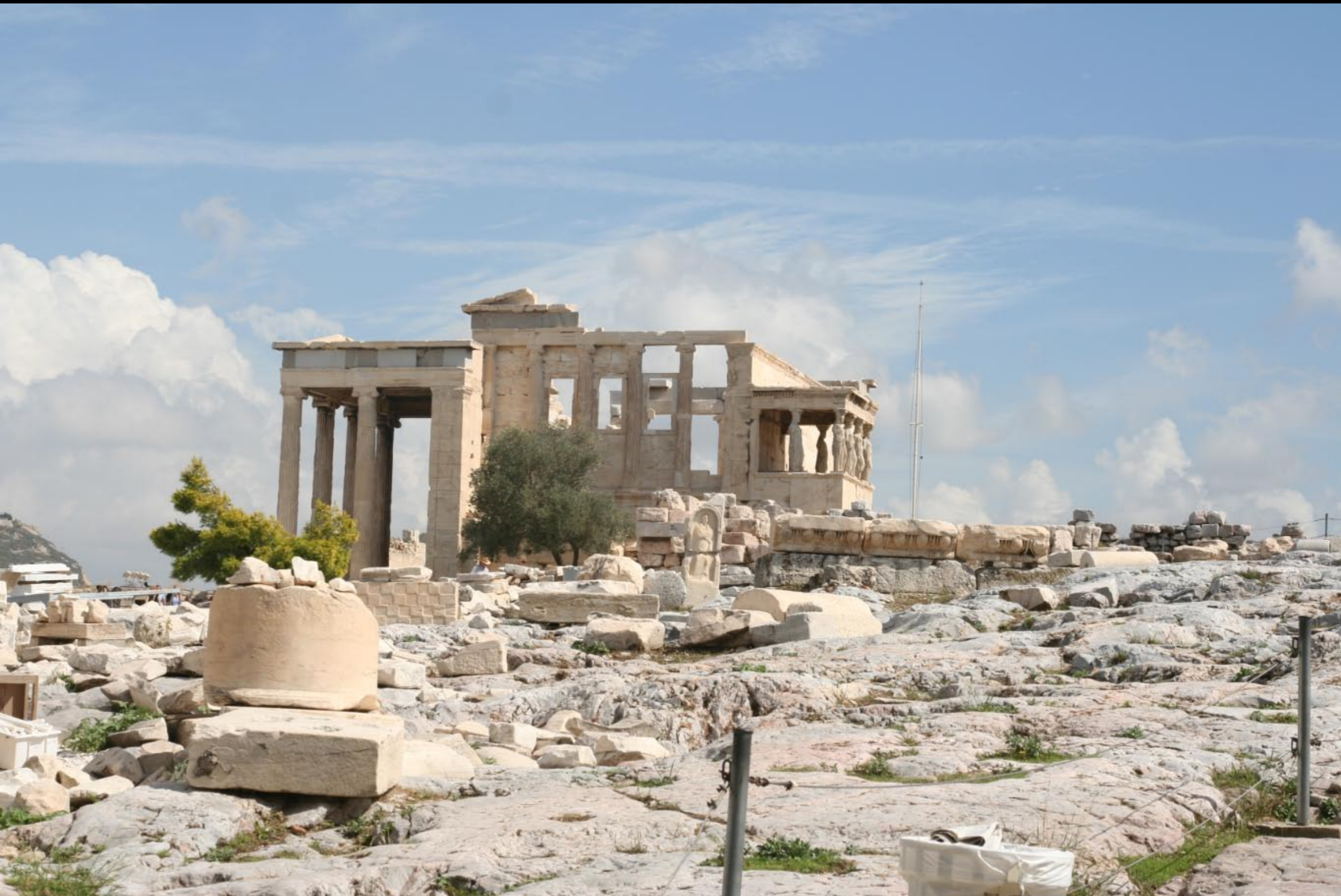
Erechtheion, a side temple