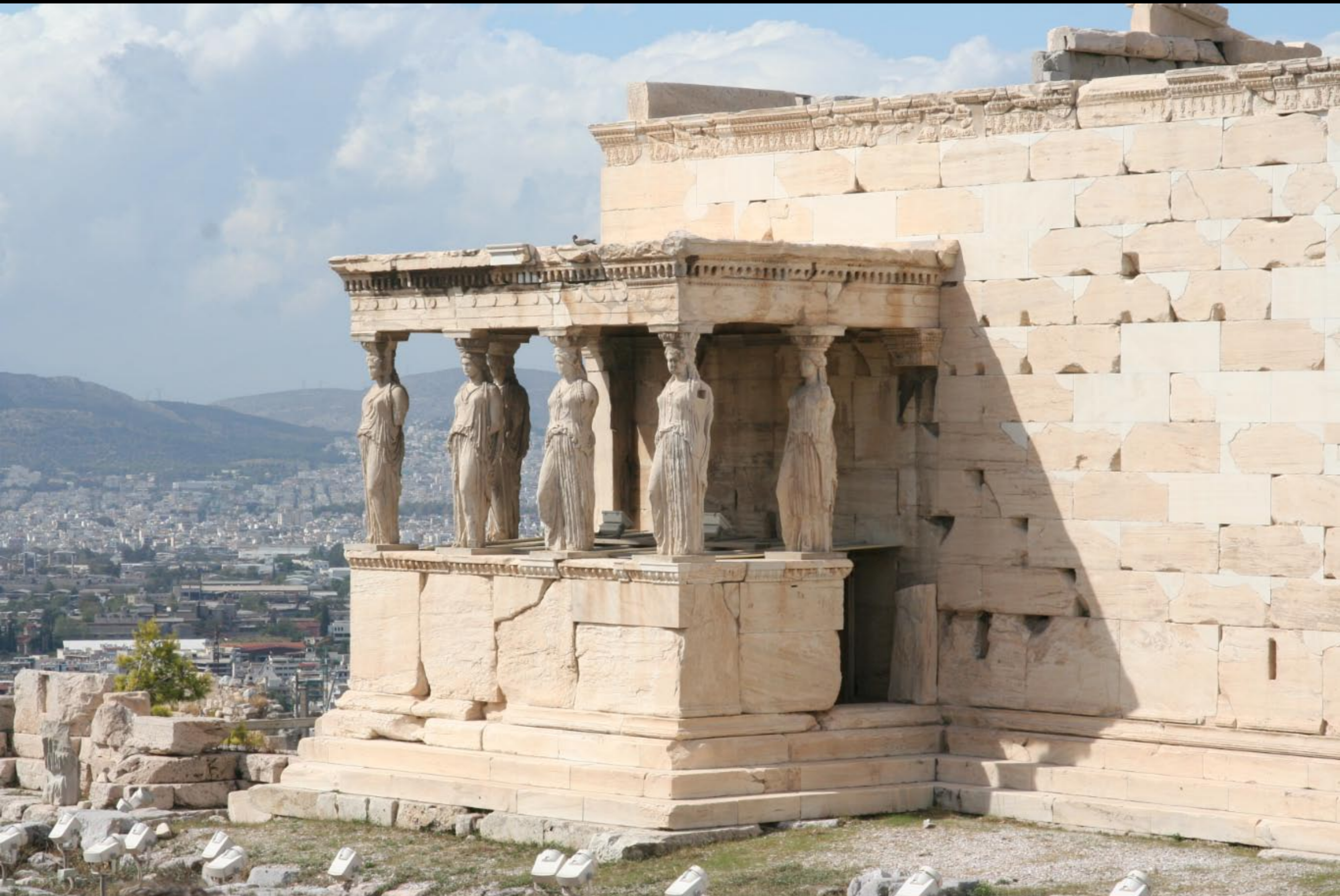
Beautiful maidens holding the roof imagine this at its peak!